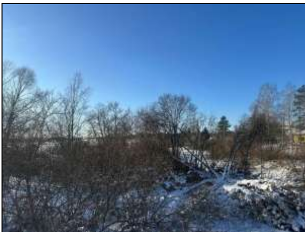
Skats uz zemes vienības DR daļu