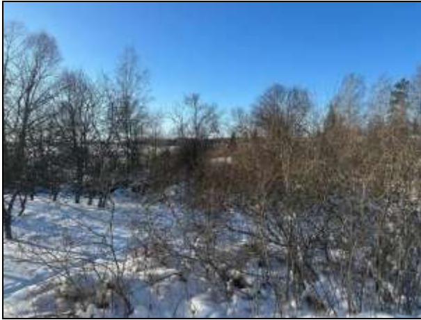
Skats uz zemes vienības DA daļu