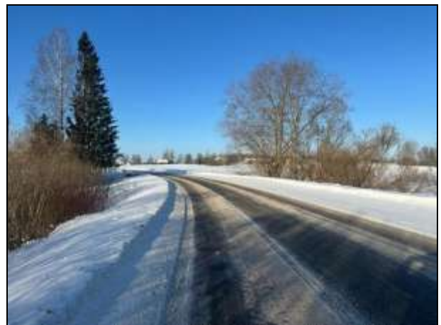
Skats uz Ērgļu ielu, gar zemes vienību