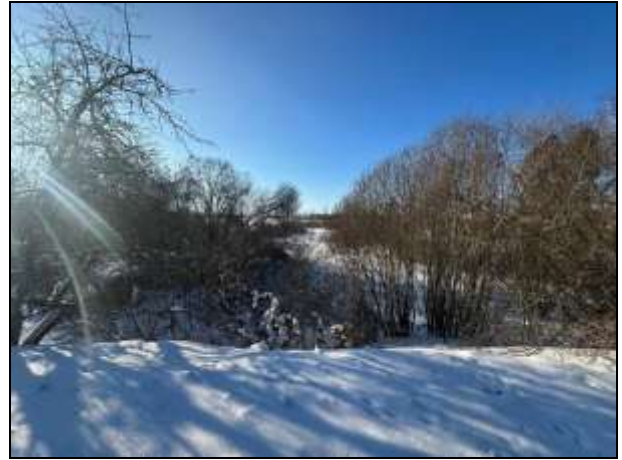
Skats uz zemes vienības centrālo daļu