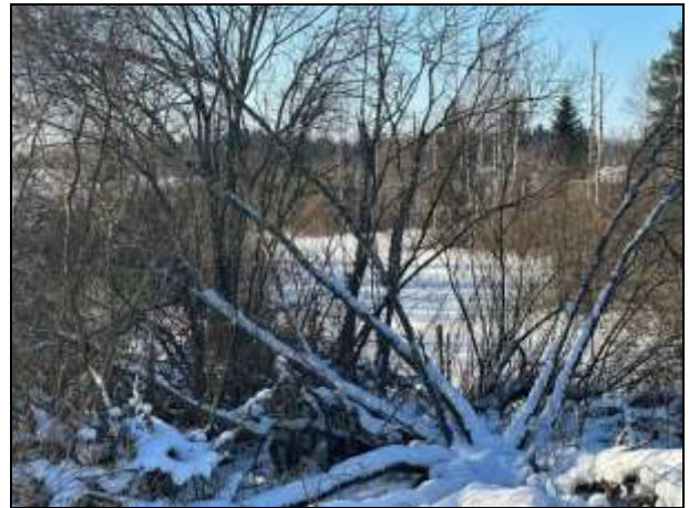
Skats uz zemes vienības centrālo, dīķi